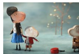
LA PETITE CASSEOLE D' ANATOLE d' ERIC MONTCHAUD